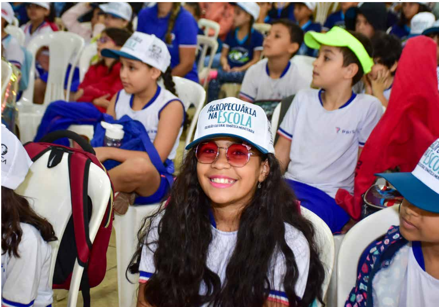
As crianças participaram ativamente do projeto Agropecuária na Escola, que promoveu a educação ambiental e cidadã na Expoagro GV