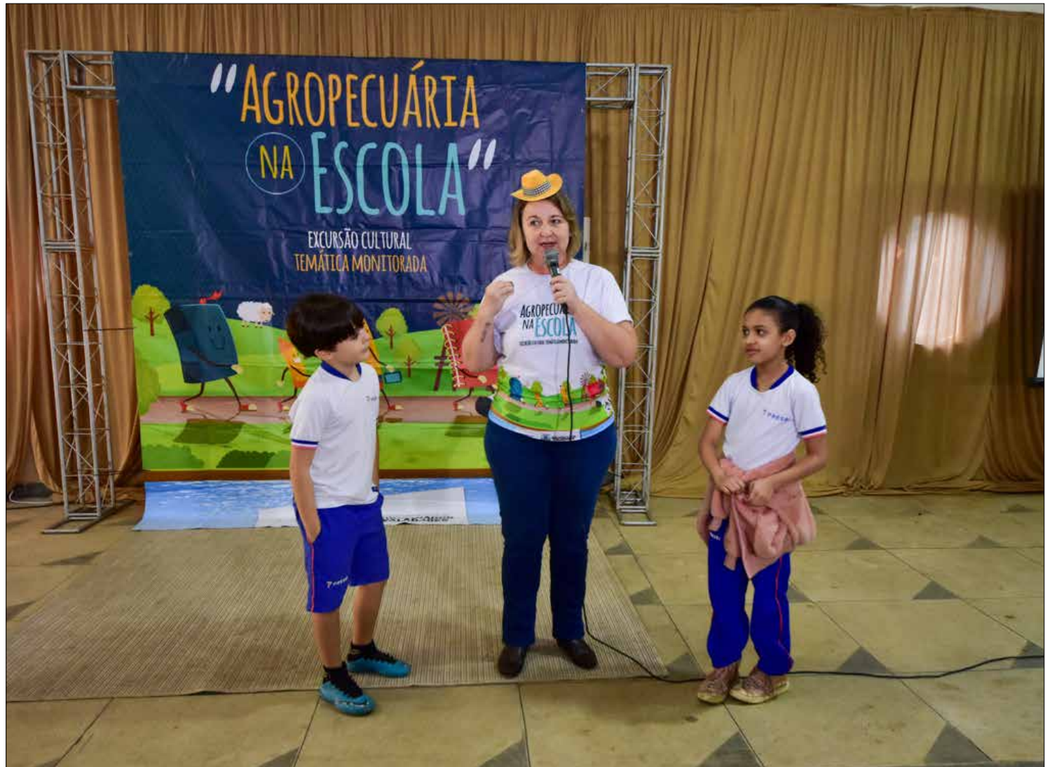
As crianças do projeto recebem demonstrações sobre o funcionamento do processo da cadeia produtiva de leite, de carne e outros