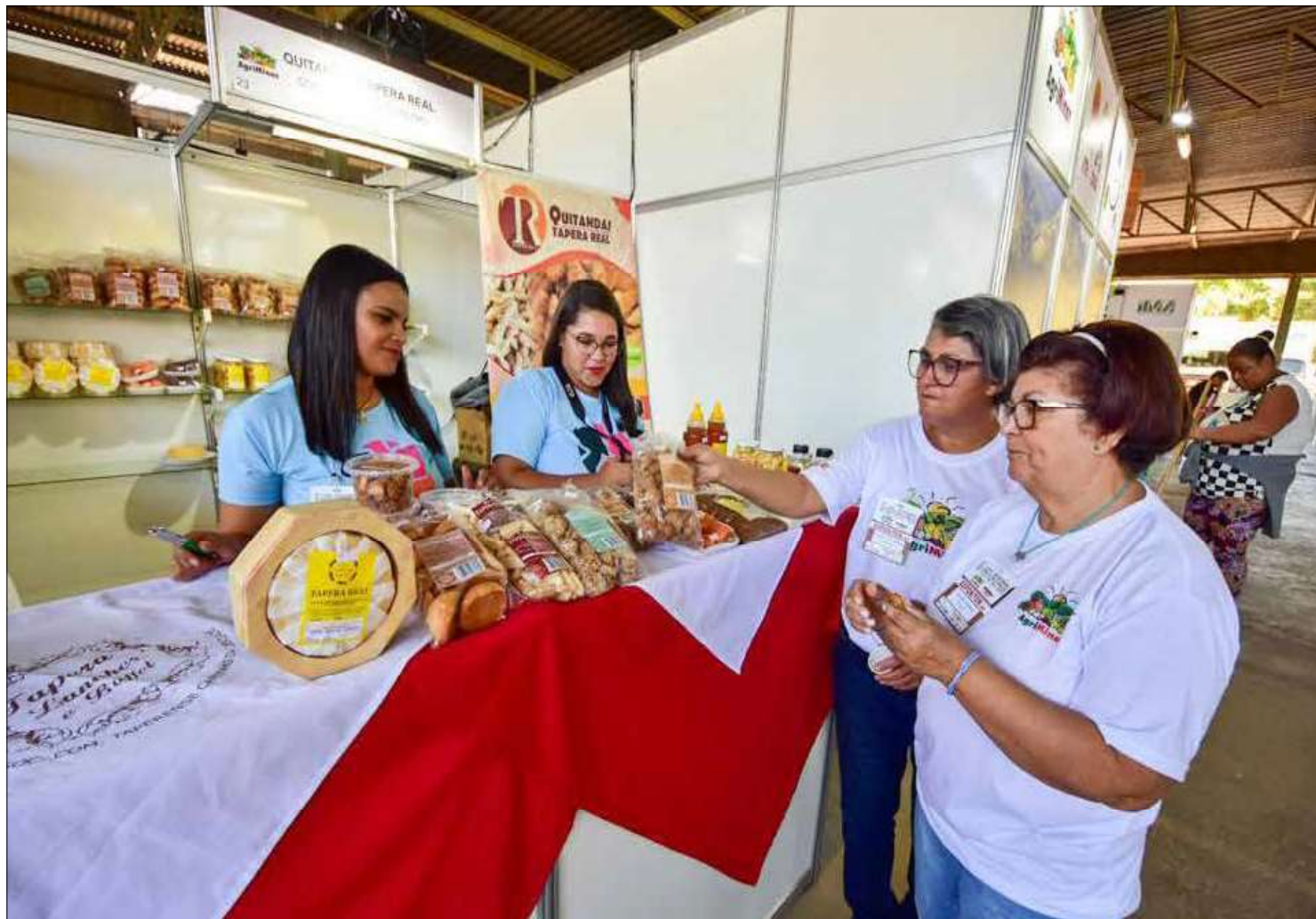
A Feira da Agriminas é um grande mercado aberto à agricultura familiar, revelando produtos e talentos artesanais. A feira está conquistando o público

Na feira tem de tudo um pouco...tem linguíça, tem cachaça, tem quitandas, tem artesanato, tem pimentas, molhos e conservas, tem o melhor café do Brasil eleito em 2022, tem verduras, legumes, frutas, plantão técnico da EMATER e muito mais.