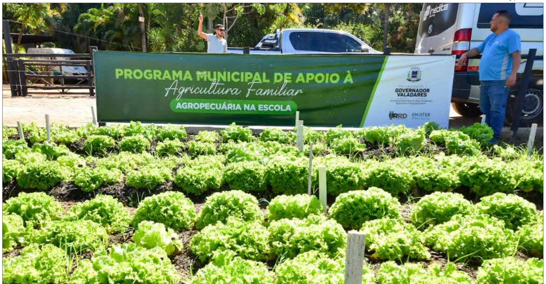
A Fazendinha difunde a atividade agropecuária por sua importância na economia, na sustentabilidade e na segurança alimentar. O projeto é iniciativa da SEMA/Prefeitura de Valadares