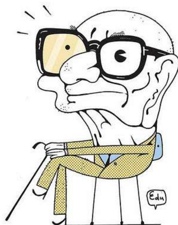
Caricatura do poeta Mário Quintana, feita por Edu e reproduzida da Internet

O lirismo quintanares de Sapato Florido em 1948 confirma a verve de prosista da poesia, construtor de enunciados repletos de humor e reflexões. Adágios poéticos? Pode ser, mas sempre o adjetivo da poesia dando vida ao substantivo que se queira escolher. Em boa medida: Provérbio. O seguro morreu de guarda-chuva. E para justificar o mau hábito de tabagista: Arte de fumar. Desconfia dos que