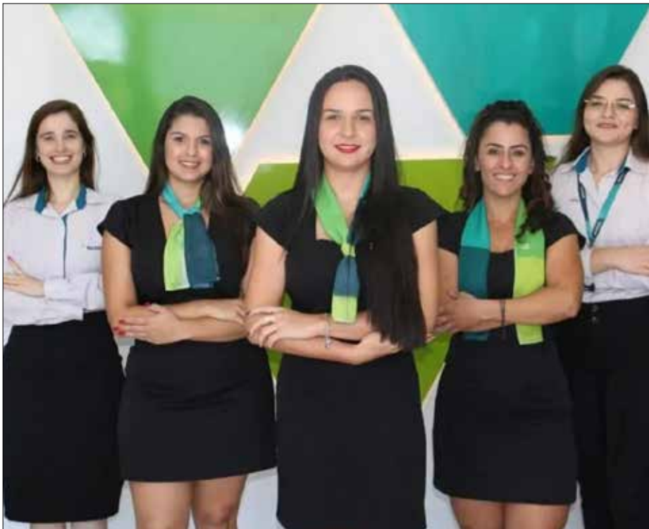
Funcionárias atenciosas e bem informadas do Sicoob CREDICOPE