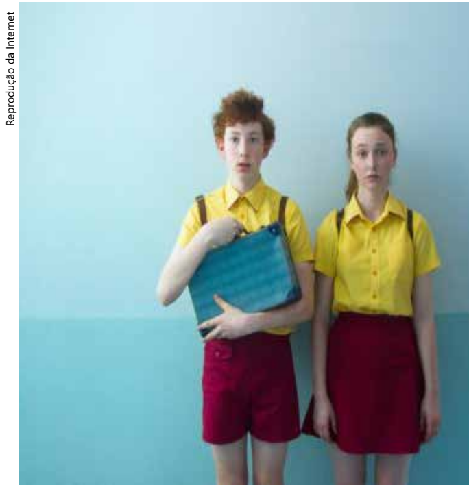
Foto de divulgação do filme O Sonho de Greta