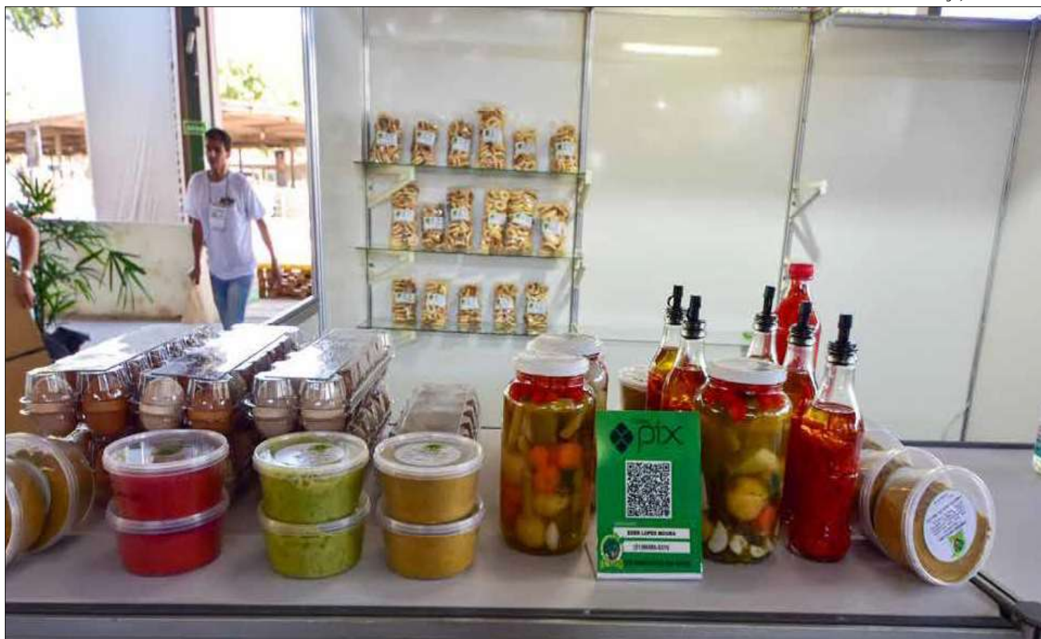
Os produtos vendidos na Feira da Agriminas mostram a força de trabalho dos agricultores familiares da região