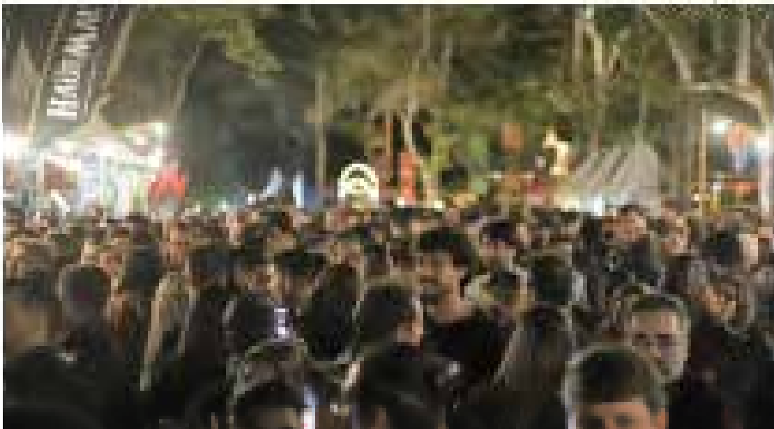
O festival acontece no Pico da Ibitorona em Governador Valadares, com muita música e dança