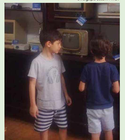
Durante as férias, as crianças foram ao Museu

A Educação de Jovens e Adultos não haverá alteração, ou seja, as aulas permanecem em horário normal.