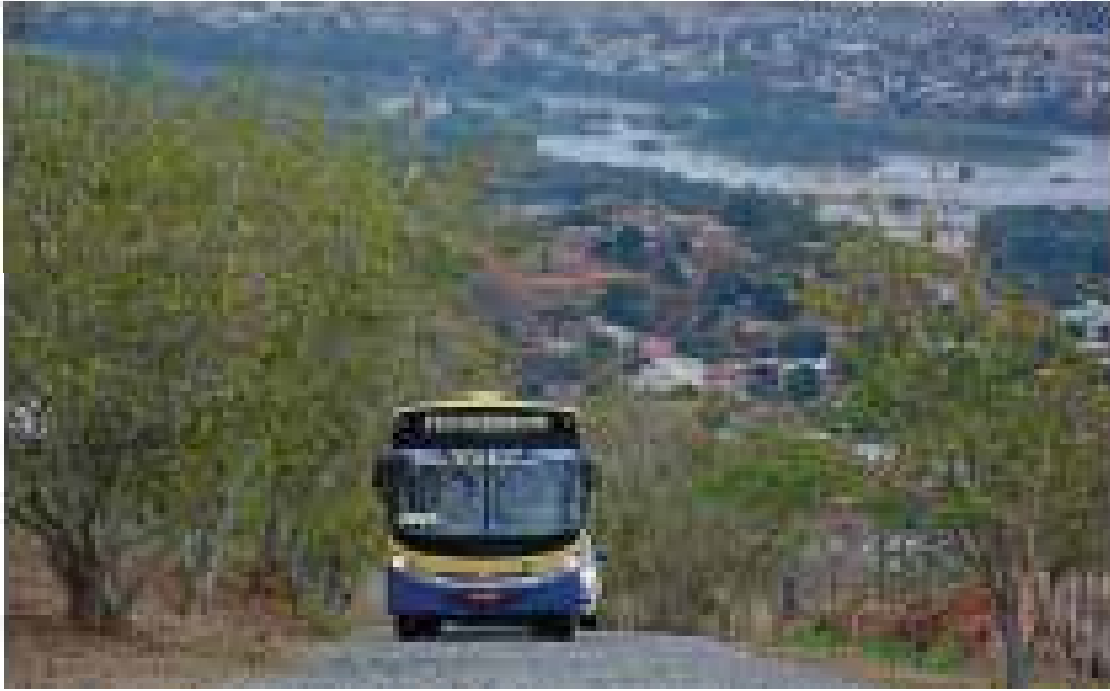
Terminou o teste | O Ônibus Ibitorona no Pico da Ibitorona se tornou uma linha de transporte