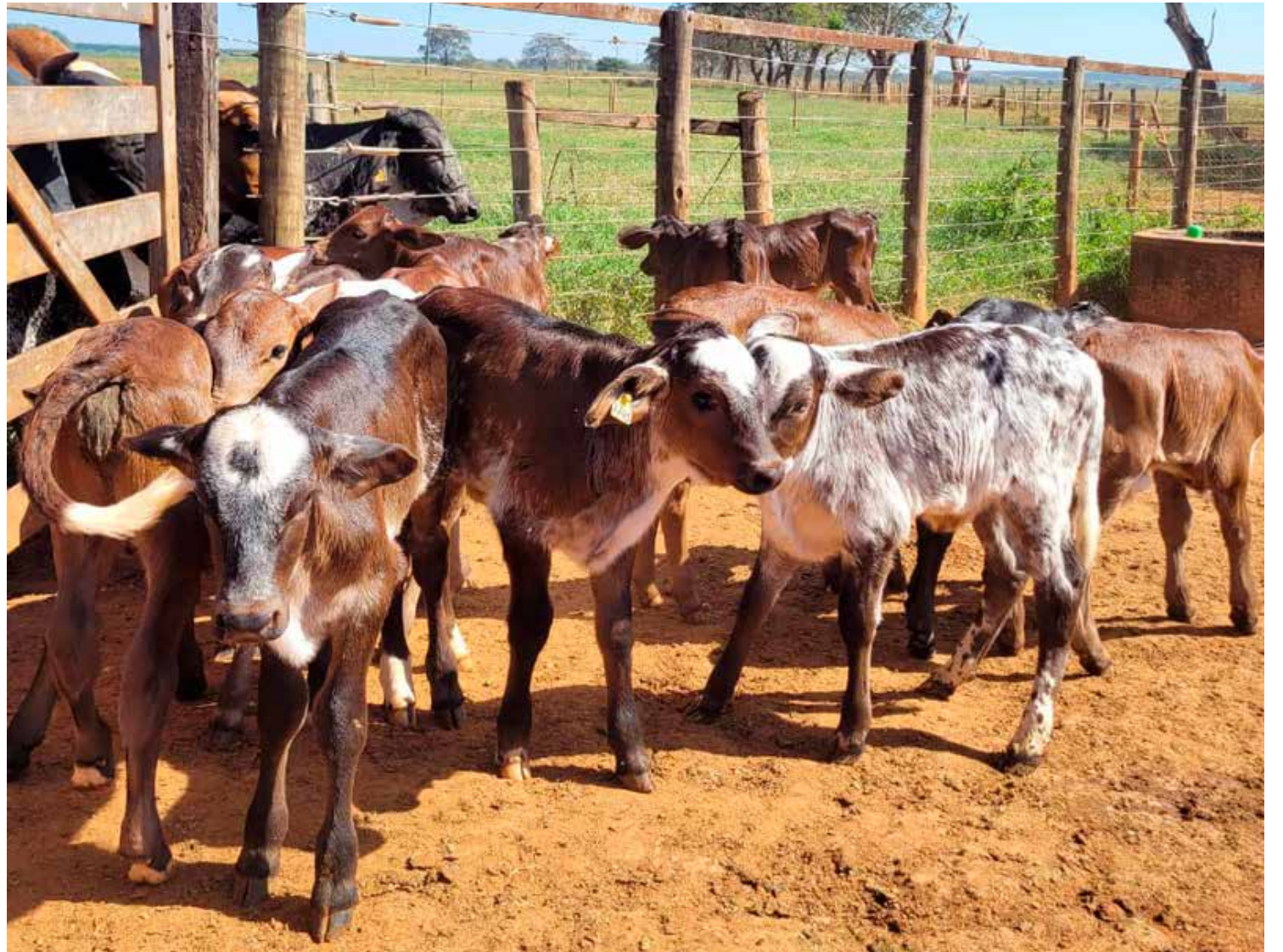
O Gir leiteiro é uma raça zebuína, originária da Índia, que possui boa adaptabilidade e alta produtividade leiteira em regiões de clima tropical

O Campo Experimental Getúlio Vargas, da Epamig em Uberaba, é referência na seleção e no melhoramento genético do gado Gir Leiteiro no Brasil. Os trabalhos, que tiveram início na década de 1940, contemplam áreas como reprodução, produção e qualidade